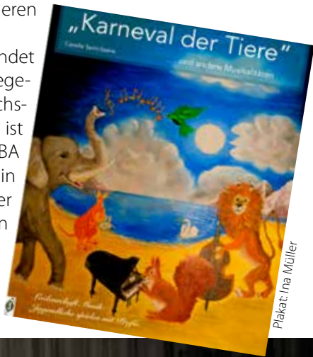
Plakat: Ina Müller